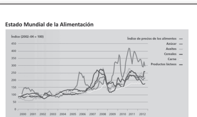
Nota: Los índices de precios con observaciones mensuales tomadas de enero de 2000 a agosto de 2012. Reflejan los precios reales, sin ajustes en función de la inflación.

En el mundo, al finalizar el año 2012, los mayores índices de hambre y pobreza extrema, así como los menores índices de inversión en agricultura, se encuentran en Asia Meridional y África Subsahariana. Según la FAO, al comparar los precios de los alimentos entre 2000 y 2012, éstos han aumentado 32 puntos porcentuales en 73 países, 20 en 50 y más de 30 en 12. Durante 2012, hubo una ligera disminución de los precios en algunos productos, como el azúcar, pero, en la mayoría de artículos, los valores continúan siendo elevados. En algunas regiones, los problemas de abastecimiento se han agravado, pues parte de la producción se vende para aprovechar la creciente demanda exterior, particularmente, la de los países emergentes y en desarrollo, como Europa Oriental y China.