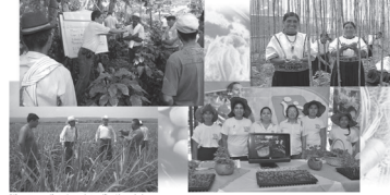
Diálogo y fortalecimiento de seguridad agrícola.

En 2009, la FAO planteó la tesis de que era necesaria una inversión anual de 209,000 millones para que, en 2050, los 93 países en vías de desarrollo pudieran satisfacer la creciente demanda de alimentos. Sin embargo, señaló que todavía no estaba cuantificada la cantidad requerida para que dichos nacimientos pudieran ser declarados libres de la desnutrición y del hambre.